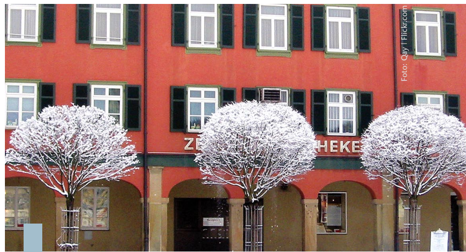
Immobilienbesitzer haben gut lachen. Veränderungen werden lange vorher angekündigt, ganz anders als die Umwälzungen in der Finanzwirtschaft.

Für 2012 steht die Neufassung der Energieeinsparverordnung an. Darin werden die energetischen Anforderungen an Neubauten weiter erhöht. Die Energieausweise müssen Miet- oder Kaufinteressenten künftig unaufgefordert vorgelegt werden. In Verkaufs- und Vermietungsanzeigen soll eine Energiekennzahl angegeben werden. Für Energieausweise werden strengere Qualitätsrichtlinien eingeführt, um die Erstellung von Ausweisen mit Fantasiedaten via Internet zu unterbinden. Angedacht sind Steuererleichterungen für modernisierungswillige Eigentümer: Steuerpflichtige sollen jährlich zehn Prozent der Aufwendungen zum Beispiel für Wärmedämmung über zehn Jahre steuermindernd geltend machen können. Das CO 2 -Gebäudesanierungsprogramm soll mit neuen Fördermitteln aufgestockt werden. Wichtige Änderungen für Vermieter und Mieter verspricht das Mietrechtsänderungsgesetz: Es soll die Möglichkeit von Mietminderungen bei energetischen Modernisierungsarbeiten einschränken und die Kündigung bei Rückstand mit der Kautionszahlung sowie die Räumung von Wohnungen erleichtern.